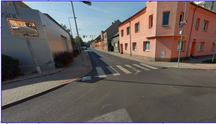
POHLED 4 - VLEVO OD SJEZDU