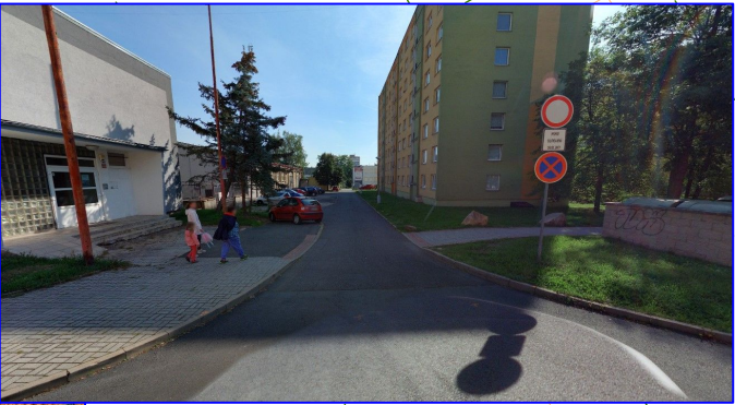
POHLED 3 - NA SJEZD