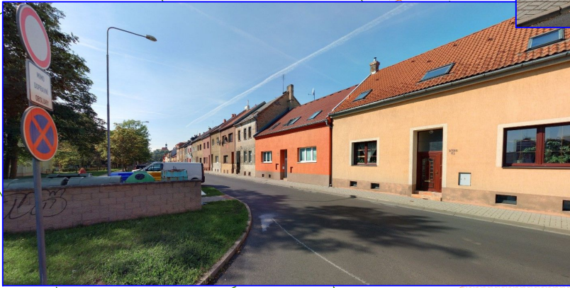
POHLED 2 - VLEVO OD SJEZDU