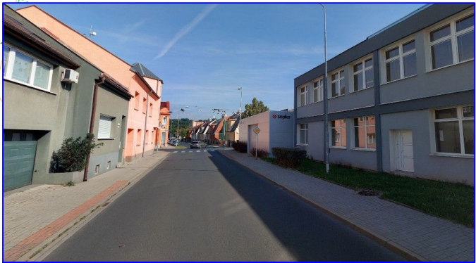
POHLED 5 - NA PŘECHOD PRO CHODCE